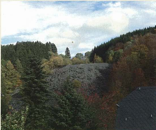
Auch außerhalb des Schieferbergwerks findet man reichlich Schiefer in der Natur.

Die Schieferbänke sind älter als die Ruhrkohle. Der Schiefer ist eine Meeresbildung und besteht aus etwa 60% Quarzsand, 40% Ton und 0 – 6% Kalk. Auch Bergkristall, Kalkspat, Pyrit und Kupferkies kommen vor. Die Gesteinsserie ist später nach Norden verschoben und gefaltet worden. Das Streichen der Bänke ist fast Ost-West, das Einfallen dagegen ist wechselhaft. Der Schiefer als Meeresbildung enthält auch Fossilien, z.B. den Tintenfisch „Orthoceras“ und selten Krebse „Trilobiten“, die infolge Faltungsdruck meist stark zerbrochen sind.